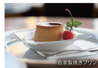
自家製焼きプリン

地元で愛され創業46年 ノスタルジックな店内で心地よい音楽と 自家焙煎の香り高い珈琲が味わえる