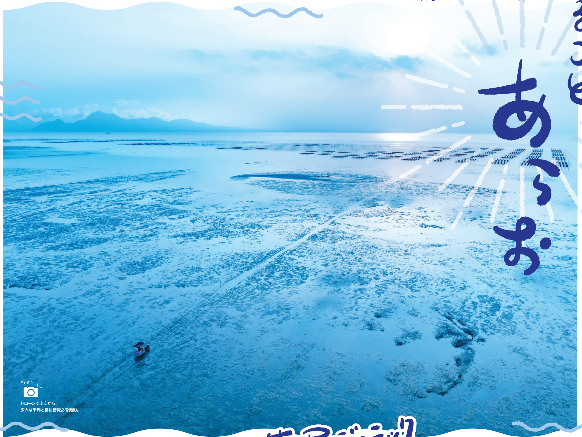
Point ドローンで上空から、 広大な干潟と雲仙普賢岳を撮影。