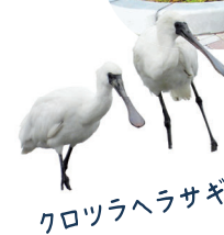
クロツラヘラサギ