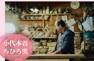
小代本谷 ちひろ窯