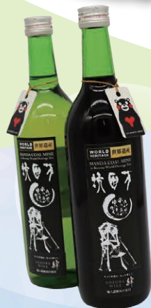
青空ワイン絆 荒尾のまちを元気にするために生まれた荒尾乃葡萄酒です。 青研 Tel. 0968-62-3446