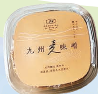
おしぎだ味噌 昔ながらの製法で作られた、こうじが多く甘みのある麦味噌です。 サトヤマカンパニー サトヤマカンパニーで検索