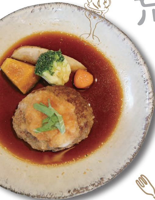
Sharara シャララ 和風ソースの 太根あるしハンバーグ