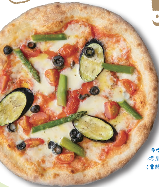
ラヴィアンシェリー ペルドゥーラ (季節の野菜のピザ)