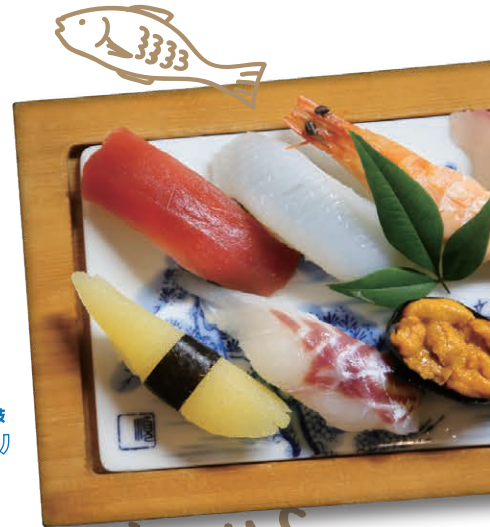
寿司小太郎 上品盛り