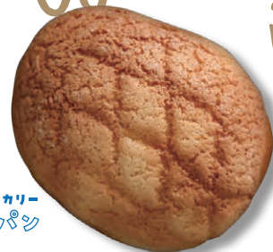
ふくやまベーカリー ※回シパン