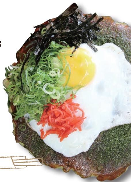
お好み焼 源ちゃん 石炭ゴロゴロ万回焼